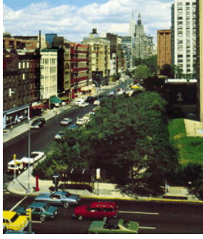
Alan Sonfist, "Time Landscape of New York City"

Alan Sonfist 1946 yılında Amerika’da doğmuş çevreci bir sanatçıdır. Sonfist’in heykel, resim, çizim ve fotoğraf çalışmaları bulunmaktadır. Sanatçı, doğal çevrenin tarihini yansıtmak için yaptığı çalışmalarını, tarihi anıtları anımsatır şekilde şehrin içinde yapmayı önermiştir. 1965 yılında yaptığı “Zaman Manzaraları” (Time Landscape) isimli bu çalışmalarında eskiden yetişmiş fideleri, ağaçları yetiştirip, o bölgede daha önce ne çeşit bitkilerin olduğunu insanlara anımsatmak ve yitirilen şeyleri hatırlatmayı amaçlamıştır.