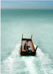
Allora and Calzadilla, “Under Discussion”