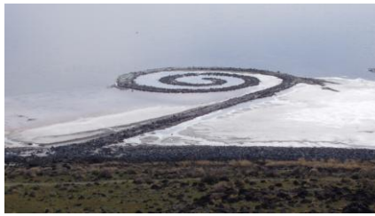
Robert Smithson, “Spiral Jetty”