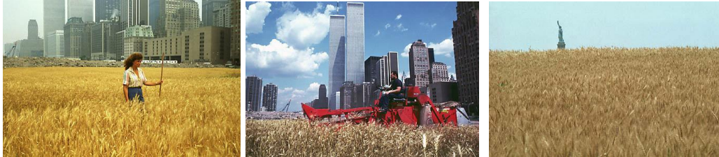
Agnes Denes, “Wheatfield – A Confrontation”

1931’de Budapeşte’de doğan Arazi Sanatçısı Agnes Denes bilim, felsefe, şiir, tarih, müzik gibi birçok alanla ilgilenmiştir. Sanatçının tanındığı ve en bilinen eseri New York’ta yaptığı ekolojik sorunlarla ilgili olan “Wheatfield – A Confrontation”dur. Aşağı Manhattan’da, 2 dönümlük bir arazi olan Battery Park Landfill’e, çelikten gökdelenlerin ortasına güzel bir altın buğday tarlası ekerek görsel bir çelişki yaratmıştır. Çalışma 1982’de 6 aylık bir süreçte tamamlanmıştır. Sanatçı oraya kamusal bir heykel tasarlamaktansa, bir buğday tarlası ekmenin kalıcı bir bilinç yaratacağı ve yanlış önceliklerimize dikkat çekeceğini düşünmüştür.