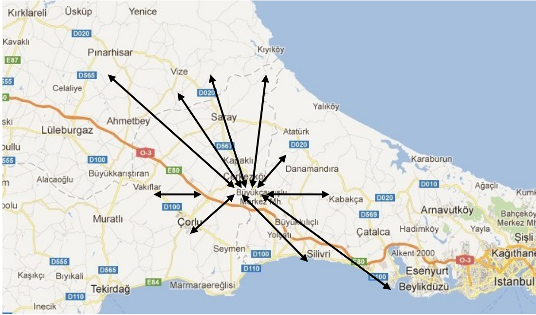
Fig. 7. 1980'lerin başında servislerle işçi temin edilen bölgeler. 23